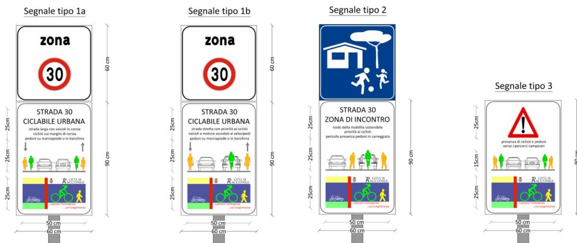
Prima bozza di progettazione della segnaletica di regolamentazione (poi semplificata in seguito al parere MIT)