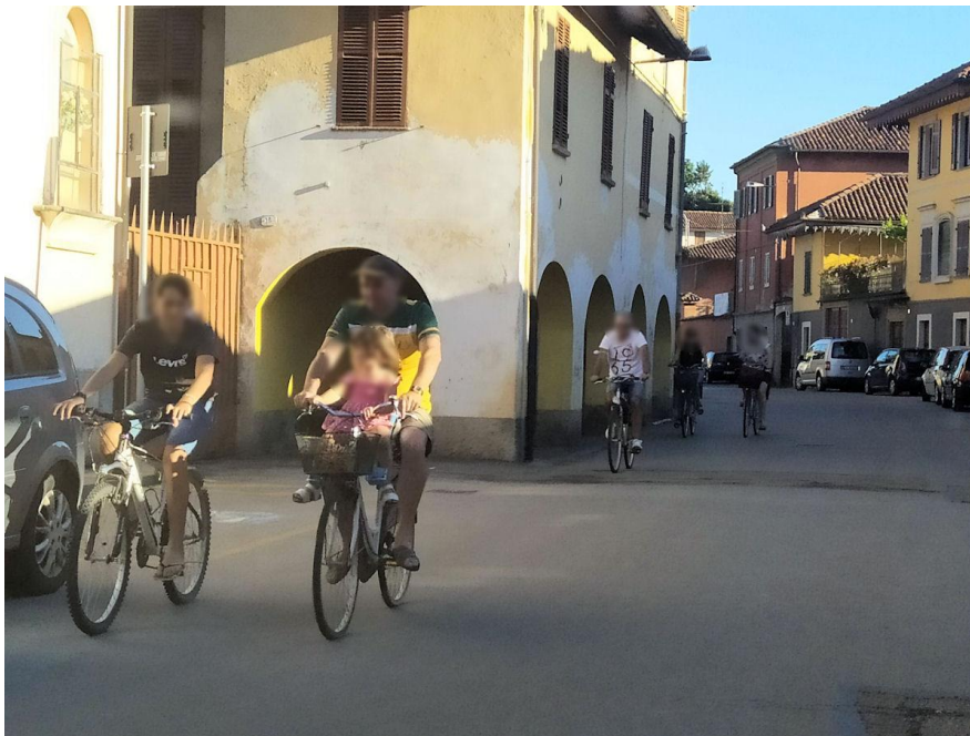
Cittadini racconigesesi lungo Via Vittorio Emanuele III in un pomeriggio domenicale

Da questo importante parere, giustamente semplificativo, oltre che dall’analisi approfondita del sottoscritto su casistiche nazionali ed internazionali sulla risoluzione di problematiche di gestione dello spazio stradale in seguito all’emergenza Covid-19 (cui anche l’ANCI ha dato importanti orientamenti in merito), è scaturita la presente progettazione che viene in seguito descritta.