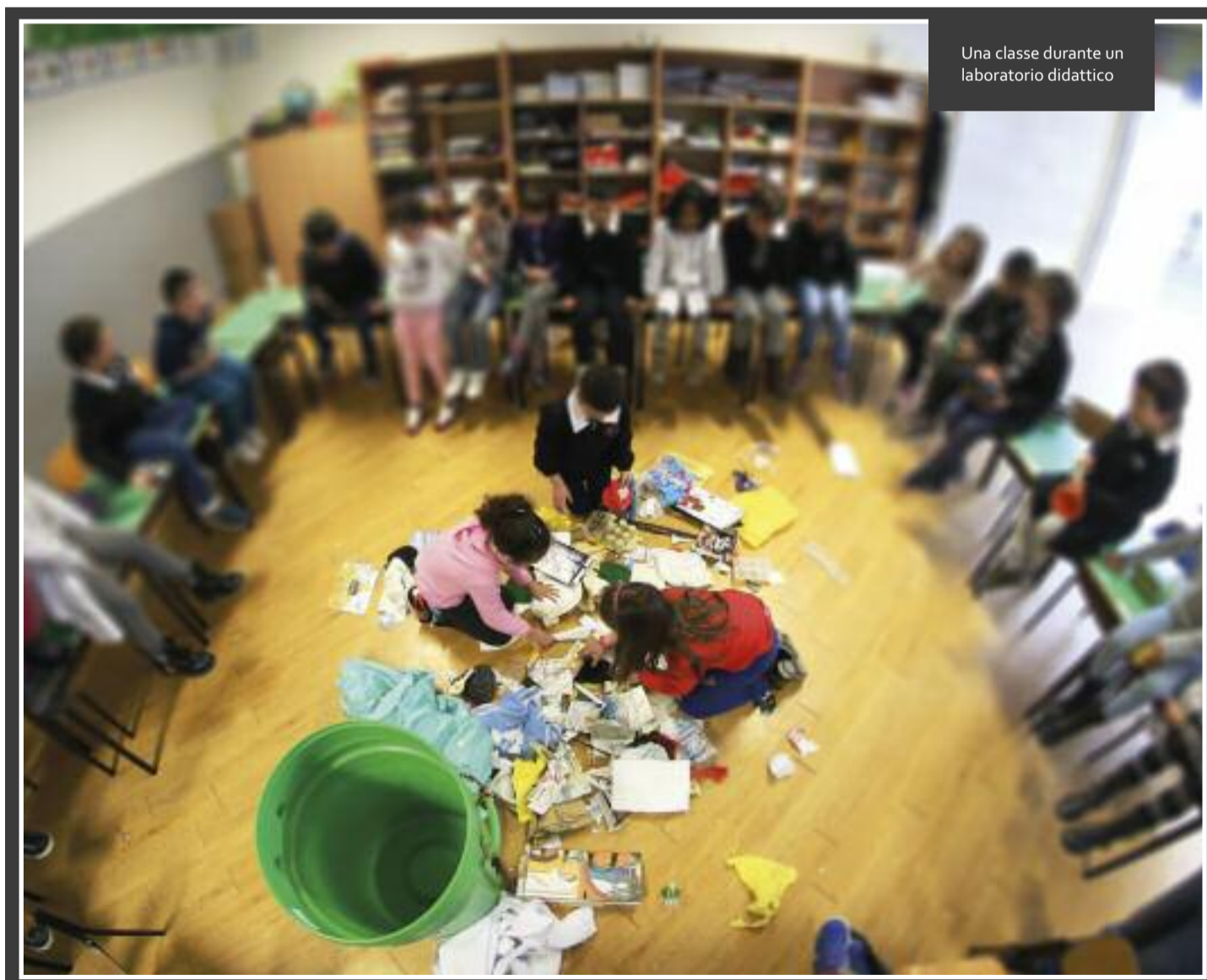
Una classe durante un laboratorio didattico

Guarda il Book Trailer di Katy-Kat su youtube!! Segui il link: https://youtu.be/Hs7saUJM9o